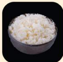
17 - ข้าวญี่ปุ่น 43.-