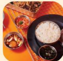
15 - ซุดข้าวโพดอ 102.-