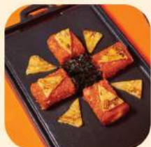
16 - ข้าวผัดกิมจิซัส 385.-