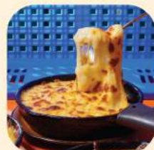
10 - มินอบชีสทรัฟเฟิล 257.-