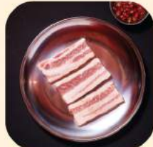
02 - หมูสามชั้นซอสปลาธา เกาหลี 300.-