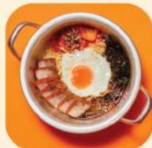
14 - มวยอ รมายอน 342.-