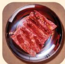
07 - ริบอาย 380.-