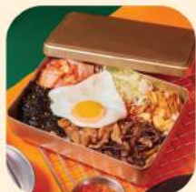
18 - ข้าวกล่องเย่า 332.-