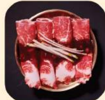
05 - หมูคุโรบุตะสไลด์ ราดซอสลูกแพร์ 427.-