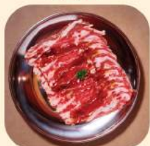
06 - เสือร้องไห้ 423.-