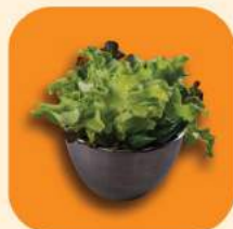
19 - พักสด 64.-