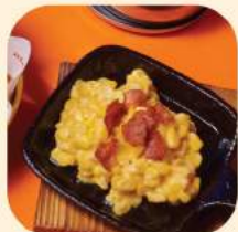
11 - ข้าวโพดอบเบคอน รมควัน 128.-