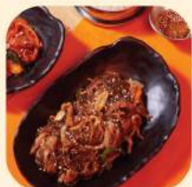
08 - จับเซ 246.-