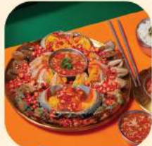
01 - ปุดองซีวเกาหลี 2 ตัว 1,177.-