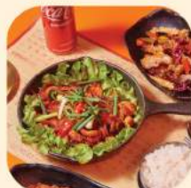
09 - ปลาหมึกผัดเผ็ด 364.-