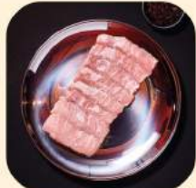
03 - คอหมู 310.-