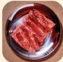
07 - ริบอาย 369.-