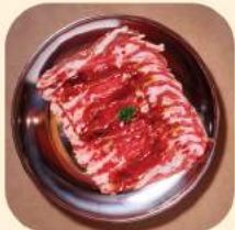
06 - เสือร้องไห้ 391.-