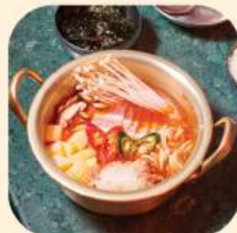
12 - ซุปเต้าหู้อ่อน 374.-