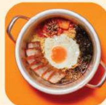
14 - มวยอ รมยอน 342.-