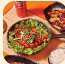
09 - ปลาหมึกผัดเผ็ด 364.-