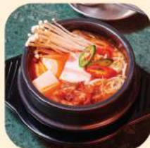
13 - ซุปกิมจิ 246.-