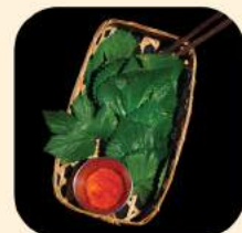
20 - ใบมาโพก 95.-