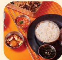
15 - ซุดข้าวโพดอ 102.-