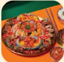
01 - ปุดองซีวเกาหลี 2 ตัว 1,177.-