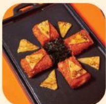
16 - ข้าวผัดกิมจิซัส 385.-