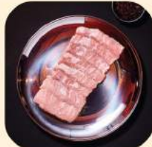
03 - คอหมู 294.-