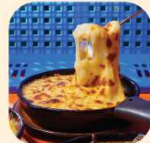
10 - มินอบชีสทรัฟเฟิล 235.-