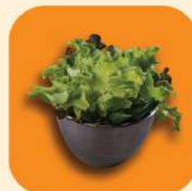
19 - พักสด 64.-