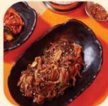
08 - จับเซ 235.-